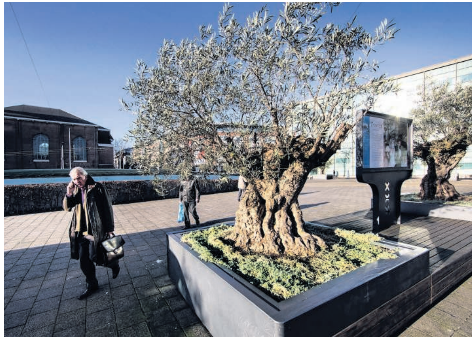
Olijfbomen in Amsterdam zijn ruim 250 jaar. Vanwege het klimaat is het de vraag of daar nog eens honderden jaren bijkomen.