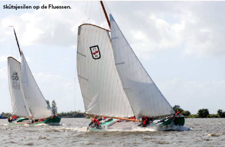
Skûtsjesilen op de Fluessen.

is geboren in Lippenhuizen. Hij is assistent-bondscoach van de Oranje-voetbalvrouwen en behaalde successen als trainer van SC Heerenveen, Ajax Cape Town en Jong Oranje. Zijn Foppe Fonds zet zich in voor kinderen voor wie sporten niet vanzelfsprekend is door een lichamelijke afwijking.