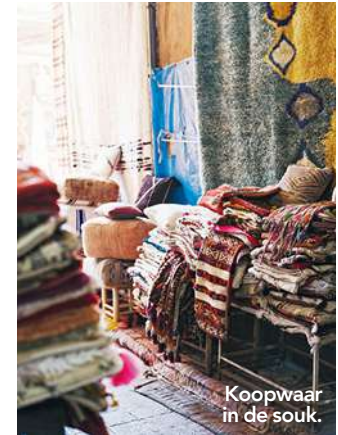
Koopwaar in de souk.

wat opdringerig kunnen zijn – naar de leerlooierijen in het noordelijk deel van de Medina laten leiden. Sla het aangeboden bosje munt voor in de neusgaten niet af.