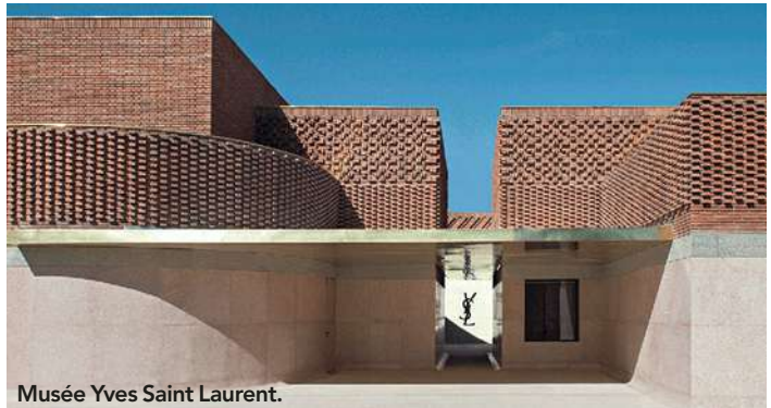
Musée Yves Saint Laurent.

Bang voor voedselvergiftiging? Vermijd salades en ijsblokjes en kies eetstalletjes en restaurants uit waar het druk is en waar veel locals komen.