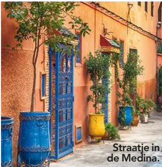
Straatje in de Medina.