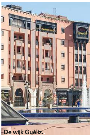
De wijk Guéliz.

rassen, kleine galerietjes en stijlvolle modewinkels. In de wijken Guéliz en Hivernage toont Marrakesh zijn moderne gezicht. Wie niet meer de benen heeft om te gaan winkelen, kan zich laten vertroetelen in een van de hamams van de luxehotels.