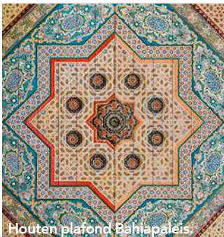
Houten plafond Bahiapaleis.

Marrakesh is een van Marokko's koningssteden en de paleizen in het zuiden van de stad zijn een statig aandenken uit de tijd van sultans. Toen sultan Ahmed el-Mansour de scepter zwaaide, was El Badi een van de grootste en mooiste paleizen in het noordwesten van Afrika. Tegenwoordig regeren er de ooievaars, die hun nesten in de ruïnes van dit nog steeds indrukwekkende paleis hebben gebouwd. Het Bahiapaleis, gebouwd in de 19de eeuw, is nog wel in volle glorie te bewonderen.