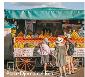
Place Djemaa el Fna.

Aan het eind van de middag maken de fruitkraampjes, slangenbezweerders en straatartiesten op de Place Djemaa el Fna, het grote plein, plaats voor talloze geurende eetstalletjes. Naast slakken en geitenhoofd zijn er ook minder griezelige lokale specialiteiten te krijgen zoals de harirasoep, gegrild lamsvlees en gerechten uit de tajine. Sluit de maaltijd af met een glas gemberthee bij een van de thee-stalletjes. ▶