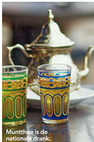
Muntthee is de nationale drank.

Als de zon op zijn felst is en de drukte in de Medina goed op gang is gekomen, is Le Jardin Secret een fijn toevluchtsoord. Deze recent gerestaureerde riad (traditioneel Marokkaans huis of paleis met binnentuin) doet de Duizend-en-een-nachtsfeer herleven. De prachtig aangelegde tuin wordt bewaard door een ondergronds irrigatiesysteem en is dan ook heerlijk koel. In het bijbehorende café worden naast muntthee ook salades en broodjes geserveerd.